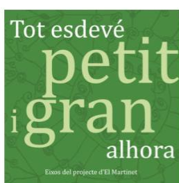
LIBRO "TOT ESDEVÉ PETIT I GRAN ALHORA"