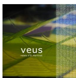
LIBRO "VEUS. RELATS D'EL MARTINET"